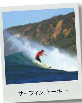
サーフィン、トーキー

ワインは、バララット地域で新しい金と見なされています。オーストラリアでも有数のワイナリーがバララットの街から車ですぐのところにあります。ほとんどのワイナリーではワインを直販しており、レストランもあります。