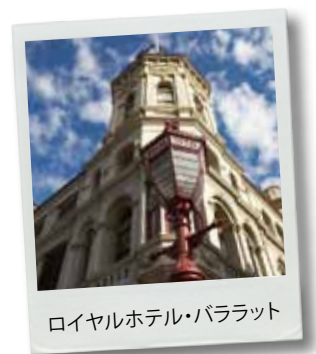
ロイヤルホテル・バララット