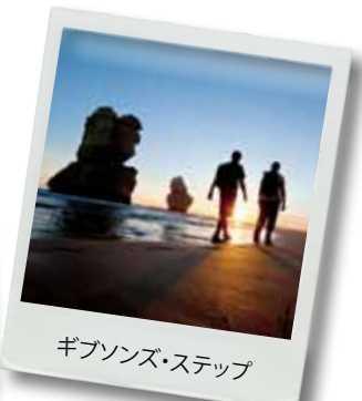
ギブソンス・ステップ