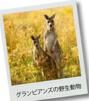
グランピアンズの野生動物