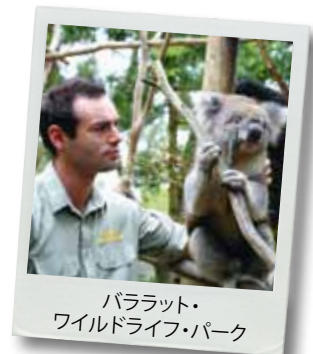
バララット・ワイルドライフ・パーク